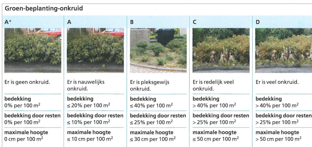
Voorbeeld RAW beeldkwaliteit Onkruid in beplanting

!GO heeft de laatste jaren laten zien uitstekend in staat te zijn om dit op de juiste manier uit te voeren. De gemeente houdt uiteraard wel de regie en bepaalt welke beeldkwaliteit wordt gevraagd, maar laat de gehele uitvoering integraal over aan het uitvoeringsbedrijf !GO.