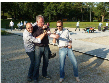
Blij met de overwinning!