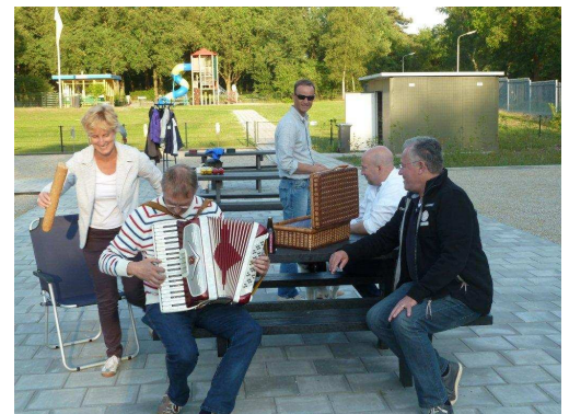
Franse sferen op de jeu de boules baan