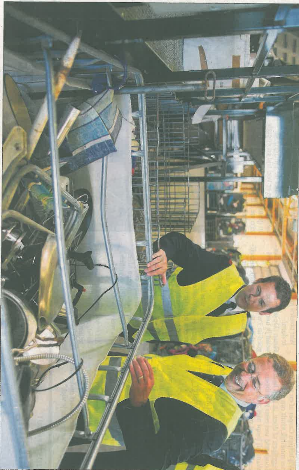
Staatssecretaris Paul de Krom bracht gistermiddag een werkbezoek aan kledinginzamelaar Lager des Heils Reshare op Weststad.